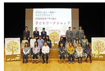
・グループワーク