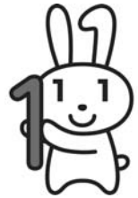
マイナンバー 広報キャラクター マイナちゃん

10月から送付を開始しているマイナンバーの通知カードは「再配達期間を過ぎた」「郵便局に転送届を出している」等の理由で、通知カードを受け取ることができなかった場合、市役所に返戻され、3か月間程度保管されます。