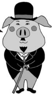
ポークチャップリン