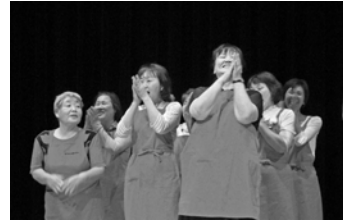
●大賞を獲得した「砂川更生保護女性会」の皆さん