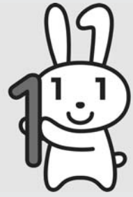
マイナンバー 広報キャラクター マイナちゃん