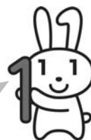
個人番号カードのイメージ