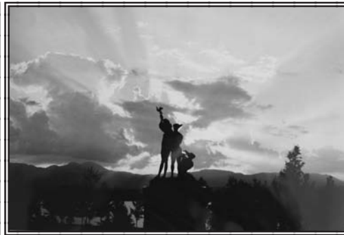
入選 「オアシスパーク・夏空」 田中 孝治