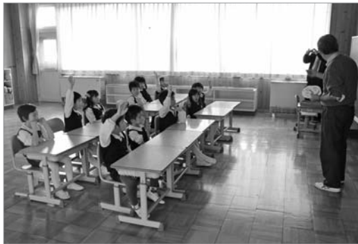
●授業中も元気いっぱい！！

来年4月に豊沼小学校に入学する砂川天使幼稚園の園児を対象とした体験授業が行われました。算数の授業では先生と一緒に魚の絵を使って数を数える練習をして、楽しくお勉強していました。また、休み時間にはお兄さん、お姉さんたちに「けん玉」や「こま」を教えてもらい、元気いっぱい遊んでいました。