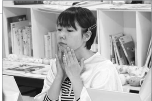
●天然の泥の化粧品を顔に塗っています

紅屋と(株)コーサーによる泥SPA体験が行われました。参加者は天然の泥を配合した化粧品でメイク落としと洗顔をしたあと、(株)コーサーの講師からアドバイスを受けながらメイクをしました。「肌が柔らかくなった」「若返った気がする」といった声も聞かれ、メイクの出来栄にも喜んでいました。