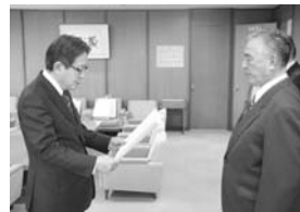
表彰状の伝達を受ける政氏氏

種統計資料の整備に多大な貢献をされました。このことが評価され、このたびの受賞となりました。