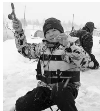
ジャリン子冬体験塾 「わかさぎ釣り」