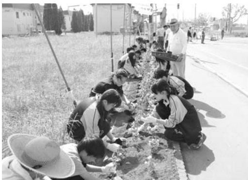
町内会の方々と石山中学校生徒の植花活動

また、砂川市いじめ防止基本方針に基づき、いじめ防止にかかわる校内組織の機能化を図るとともに、いじめや不登校などの生徒指導上の諸問題について未然防止、早期発見、早期対応を図ることができる環境づくりに努めていきます。