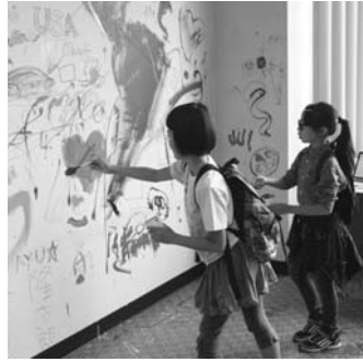
生涯学習市民の集い

砂川市では、家庭教育サポート企業をはじめ市内企業や団体等が社会教育活動に参画しており、社会教育施設はもとより、企業等の社会資源を有効に活用し、さまざまな学習への対応力を高めるなど、生涯学習活動を促進していきます。