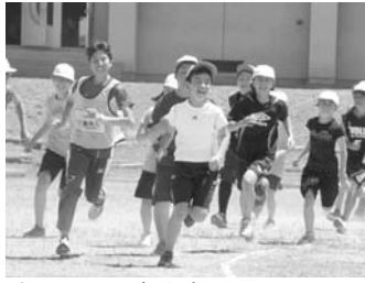
陸上部による 木クレン陸上教室

このことから、全国体力・運動能力、運動習慣等調査などから成果と課題を分析するとともに、望ましい運動習慣を定着させるための取り組みを推進していきます。