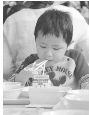
天使幼稚園給食試食会

運用し公平で的確な支援に努めるとともに、幼稚園就園奨励費補助金を見直すことで、就学前教育の充実を図っていきます。