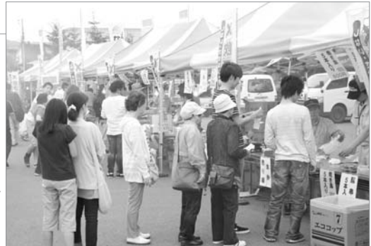
●焼き鳥を求めて行列が!!

第21回石狩川下覧権が開催され、石狩川の川下りのほか、オアシスパークで水上体験学習としてキッズボート・水上オートバイの体験試乗、夏の夕べ in 砂川遊水地などが行われました。夏の夕べ in 砂川遊水地では、ダンスやバンドライブ、こども花火大会が行われ、大人たちはビール片手に盛り上がっていました。