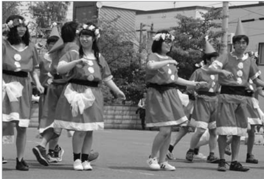
●3A 「真夏のメリークリスマス」

第13回砂川高校学校祭が開催され、仮装パレードでは各クラスが趣向を凝らした衣装で、砂川高校から市買物駐車場までの道を練り歩きました。デモンストレーションでは、「ハロウィーン」や「クリスマス」、「昔話」などをテーマにしたダンスを披露し、各クラスの団結力を見せてくれました。