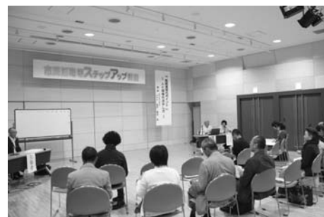
昨年のステップアップ講座の様子