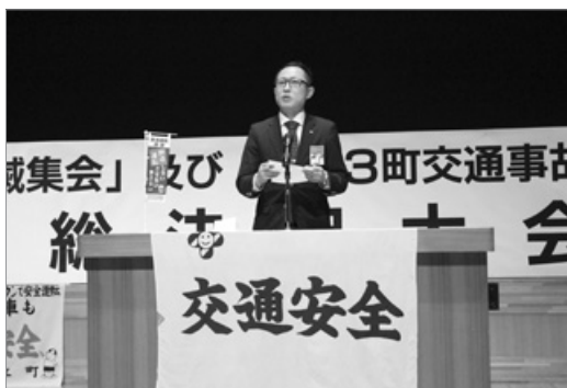
●飲酒運転と交通事故の撲滅を誓いました

一家5人が死傷した事故から2年が経ち、二度とあのような悲惨な事故を起こしてはならず、風化させてはならないと「飲酒運転撲滅集会」および「1市3町交通事故セーフティ運動」総決起大会が行われました。参加者全員で、飲酒運転や交通事故撲滅への悲願を込め大会宣言を確認しました。