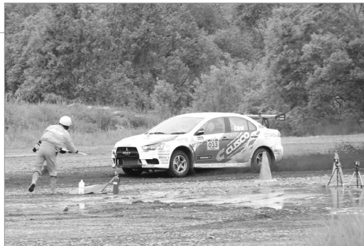
●悪路面を走り抜けてゴール!

「2017年JAF全日本ダートトライアル選手権第4戦 北海道ダートスペシャルinスナガワ」が行われました。前日の雨により、走行の難易度が高いコースとなりましたが、悪路面をものともせず、レースカーが力強く泥を巻き上げながら走り抜け、観客たちはその豪快の中にも洗練された走りに魅了されました。