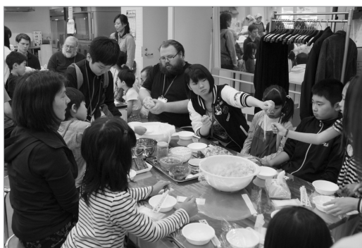
●みんなで仲良くおにぎりを作りました

ALT(外国語指導助手)の先生方とふれあう「国際交流ふれあい in 砂川I」が行われました。最初は慣れない様子で先生方に接していた子どもたちも、英語でのじゃんけんやかるたをして緊張を解きほぐしていきました。昼食でおにぎりと一緒に作って、おなかいっぱいになった頃にはすっかり打ち解けていました。