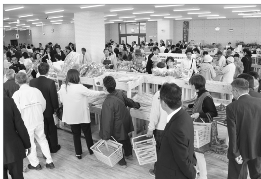
●オアシス館の新しいスポットです!

地元食材が集まる市場「空知の産直 そらいちマーケット」がこの日オープンを迎え、行列を作るほど大変多くの方が訪れました。オープニングセレモニーが行われた後は、地元産を中心とした新鮮・安心・安全のこだわり野菜や加工品が並び店内で皆さん買い物を楽しんでいる様子でした。