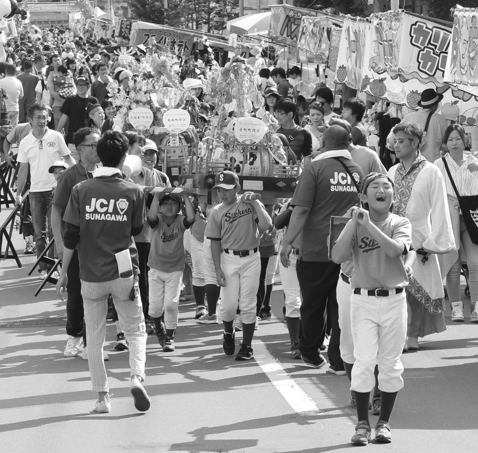
「市民まつり会場を子ども神輿が練り歩く」