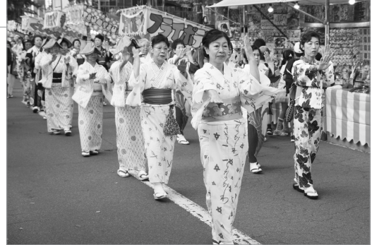
●砂川音頭が中心街に鳴り響く

砂川の夏を大いに盛り上げる、市民まつりやお祭り広場、We Love Sunagawaなどのイベントが開催されました。中心街は数々の露店が立ち並び、お祭り広場では恒例のもちまきやステージショーが行われ、最終日には復活した子ども神輿が会場を練り歩くなど、夏の終わりを飾る活気で満ちた3日間となりました。