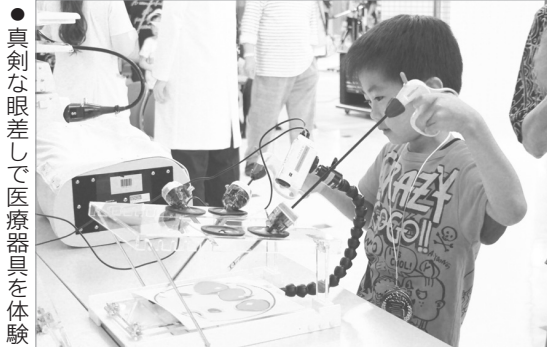
●真剣な眼差しで医療器具を体験

市立病院をさらに身近に感じてもらうため、今年で7回目となる病院祭が開催されました。医療器具の体験や簡単な体の測定ができるコーナーや講演会、馬頭琴による演奏、マジックショーなどの催しが行われ、家族連れを中心にとっても賑わいました。地域に根ざす病院として、市民と交流が深まった一日となりました。