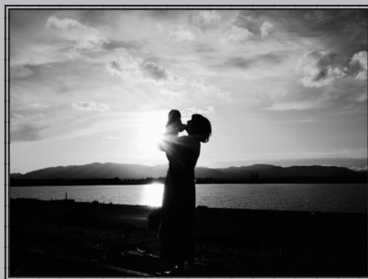
最優秀賞 「離れた故郷、我が子にも」 五十嵐 崇人