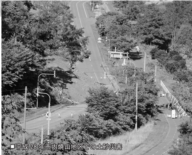
■平成 28 年市内焼山地区での土砂災害

いざという時に備えて、防災対策について一人一人が何をすればいいのかわかるのか、何ができるのか、Q & A 方式で考えてみましょう。