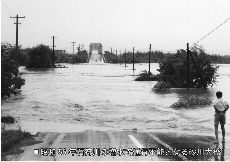
■昭和 56 年石狩川の増水で通行不能となる砂川大橋