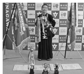
●トロフィーを手にする小室くん