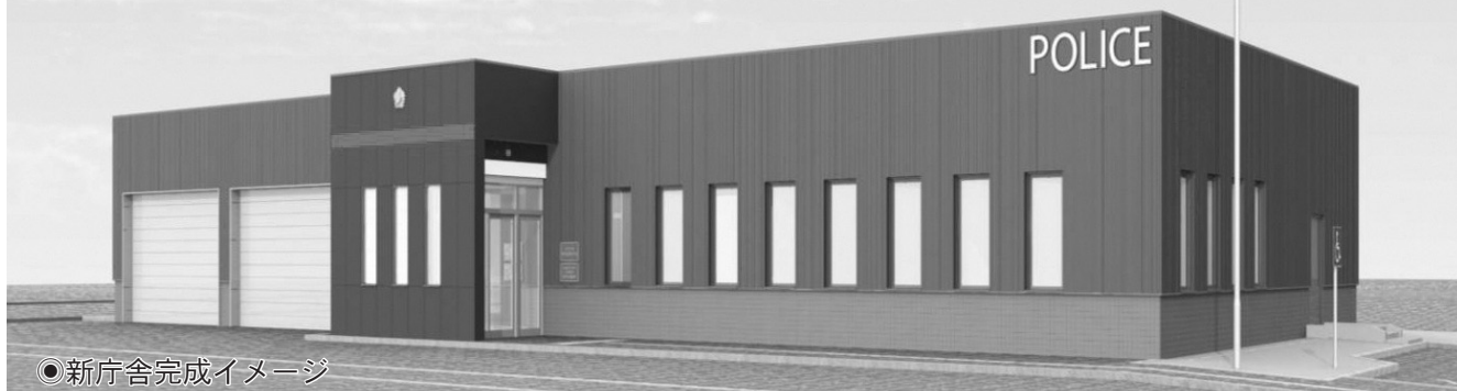
◎新庁舎完成イメージ

北海道警察では、皆さんからいただいたご意見・ご要望を可能な限り取り入れた警察庁舎とすることを基本方針として設計業務を進めてきました。このたび、設計業務が終了しましたので庁舎の概要についてお知らせします。