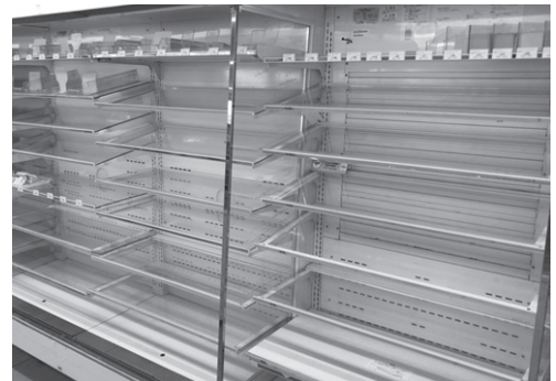
▲北海道胆振東部地震の発生後は物流が滞り、品薄が続きました

A 災害発生直後は日用品や食料品が手に入らなくなったり、支援物資もすぐには届かないかもしれません。非常食は最低3日分、できれば1週間分を目安に皆さんのご家庭でも備蓄し、災害に備えましょう。備蓄した食料は、月に1度か2度定期的に消費し、食べた分だけ買い足す方法（ローリングストック法）がおすすめです。この方法で備蓄すると、消費期限切れの防止や食べ慣れたおいしいものを選択することができ、さらに災害のことを定期的に意識することができます。