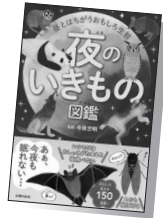
『夜のいきもの図鑑』 (今泉忠明)

10分ごとに起きないと溺れ死んでしまうジュゴン、夜だからゆっくり移動できるスローリスなど、人間がぐっすり眠っている夜中も、いきものたちはひっそりと活動しています。暗闇に生きるいきもの、昼間と違う姿を見せるいきもの、いきもののおもしろ寝相…。夜のいきもの世界を伝える150のおもしろネタをイラストとともに紹介。