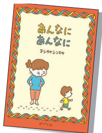
『あんなにあんなに』 (ヨシタケシンスケ / 作)

『あんなにほしがってたのに、もうこんな。あんなにしんぱいしたのに、あんなにないたのに、あんなに小さかったのに』。日常にあふれる「あんなに」の中で、子どもはだんだん大人になっていく。人気絵本作家・ヨシタケシンスケによる、いつか大人になるきみとむかし子どもだったあなたに贈る絵本。