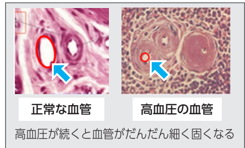
【図2】細動脈の動脈硬化