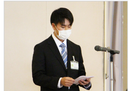
●市立病院附属看護専門学校