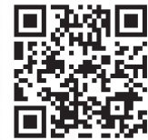
ねんきんネット ホームページ