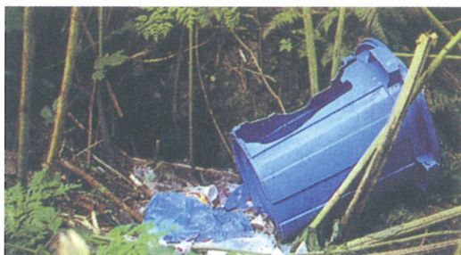
ヒグマに荒らされたゴミバケツ

実際に平成11年～21年度に渡島半島地域で銃器によって捕獲されたヒグマ586個体の胃袋を分析した結果、7.0%に当たる42個体からゴミ袋が出現しました。