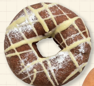
〔Donut café 豆豆.zuzu〕 ドーナツ