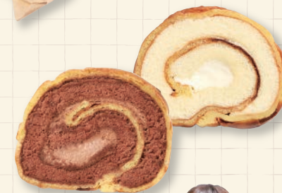
〔ほんだ菓子司〕 シューロール