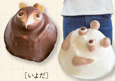
〔いよだ〕 たぬきケーキ

砂川市の魅力 「おいしいお菓子屋さんが多い、スイートロード」などの声が多く聞きました。砂川市を一度離れて戻って来た人は特に感じているようです。