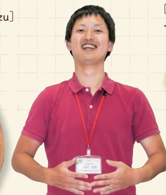
〔プチ・トリフ 山屋〕 マカロン