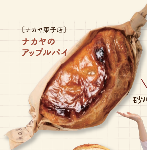
〔ナカヤ菓子店〕 ナカヤの アップルパイ

よく行く飲食店。 昭和39年創業の、「山小屋」の名前が多くありました。「炭火焼ポークステーキは、お土産でも喜んでくれます」との声もありました。