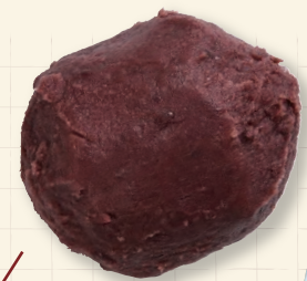
〔吉川食品〕 特製おはぎ