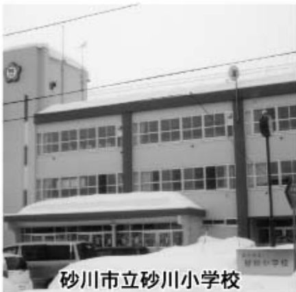
砂川市立砂川小学校

答 確かな学力の向上については、全国学力・学習状況等調査の結果を踏まえた検証・改善サイクルの確立や教員の授業力の向上と授業改善、家庭での学習習慣の定着を図ることなど。豊かな心の育成については道徳教育の充実を基盤としながら、いじめや不登校等生徒指導上の諸問題の未然防止や早期発見、早期対応の取組みを家庭や地域、関係機関と連携し進める。健康・安全に関することについては、子どもたちの基本的な生活習慣や運動習慣の改善を図るために、家庭との連携や食育の充実等に努めていきたい。今後においても教育の充実に向けた取組みを推進していきたい。