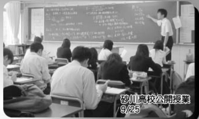
砂川高校公開授業 9/25