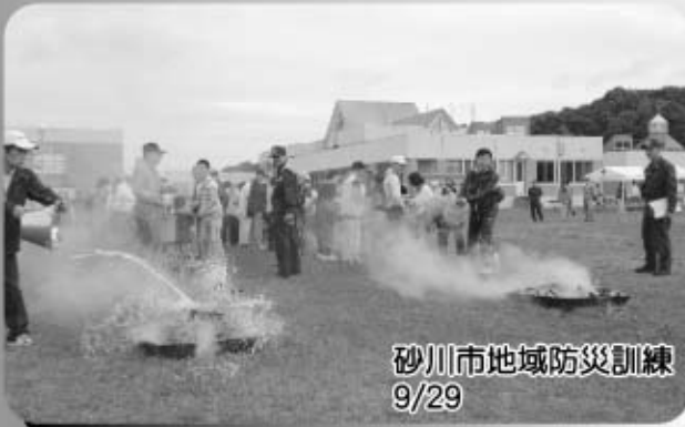
砂川市地域防災訓練 9/29