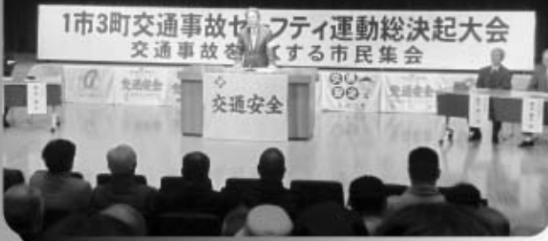
1市3町交通事故セーフティ運動総決起大会 9/24