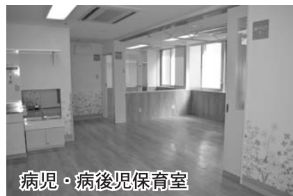
病児・病後児保育室

病児・病後児保育事業がスタートしました! 病中または病気の回復期にあるお子さんを就労などのために家庭で保育できない場合に、保護者にかわり保育する事業が10月24日にスタートしました。 施設は砂川市立病院南館にあります。 (詳細 砂川市社会福祉課)