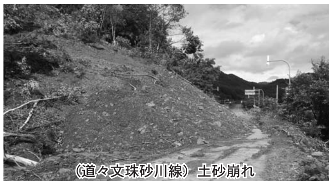
(道々文珠砂川線) 土砂崩れ