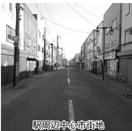
駅周辺中心市街地

今後は、インバウンドにも対応したまちなか回遊促進、創業支援事業の拡充によるまちなかでの新規創業の促進、スイートロード事業など既存の事業の充実を図るなど、中心市街地の活性化については引き続き推進してまいります。